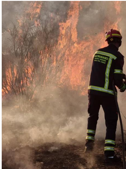
Gašenje požara otvorenog prostora

Treba posebno naglasiti da su svi požari stavljeni pod nadzor u roku nekoliko sati te da niti jedan požar nije bez lokalizacije ušao u noć.