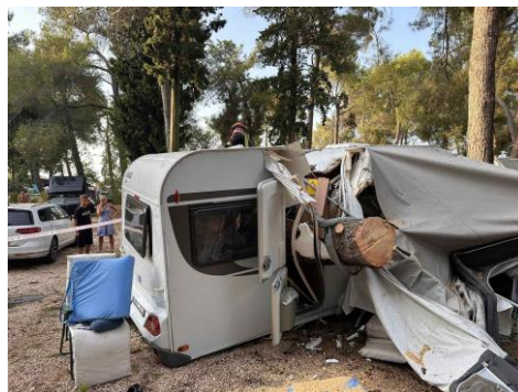
Detalji tehničkih intervencija sanacije posljedica nevremena

I u ovom izvještajnom razdoblju bilo je više intervencija spašavanja i izmicanja domaćih i divljih životinja. U prošlom izvještajnom razdoblju posebno se ističu intervencije spašavanja lovačkih psa iz jama, uništavanje gnijezda stršljena te izmještanje roja pčela iz urbane sredine.