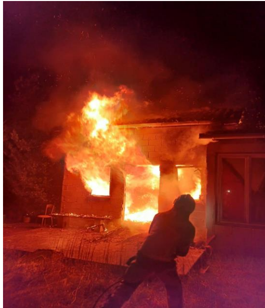
Detalji požara stambenog objekta